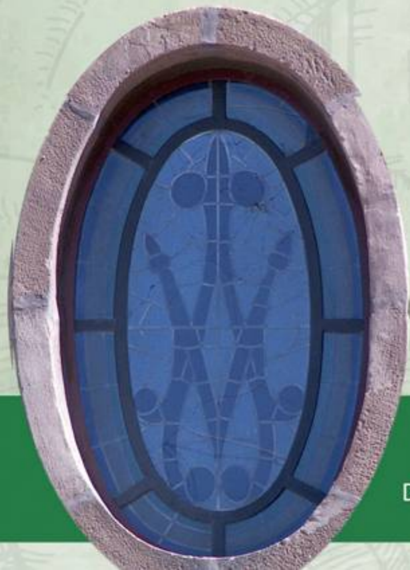
Detalle de la fachada frontal de la ermita Ntra. Sra. de Gracia