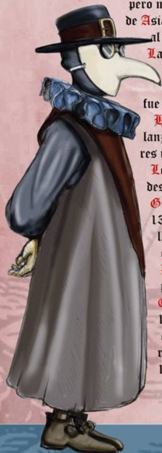
Aspecto que tenían los médicos de la época que trataban la peste. El extraño pico era en realidad una mascarilla rellena de algodones y plantas aromáticas para protegerse del mal olor.

A proximadamente 25 millones de muertes tuvieron lugar sólo en Europa junto a muchas otras en África y Asia . Algunas localidades fueron totalmente despobladas, con los pocos supervivientes huyendo y expandiendo la enfermedad aún más lejos. El descenso demográfico fue en algunas zonas realmente terrorífico. En China y en la India por ejemplo, la peste produjo entre los enfermos que la contrajeron una mortandad que iba del 60 al 90%, los índices de la pulmonar fueron prácticamente del 100%, de ahí que los cronistas de la época nos hablen de que desapareció una cuarta parte, la mitad, o incluso nueve décimas partes de la población.