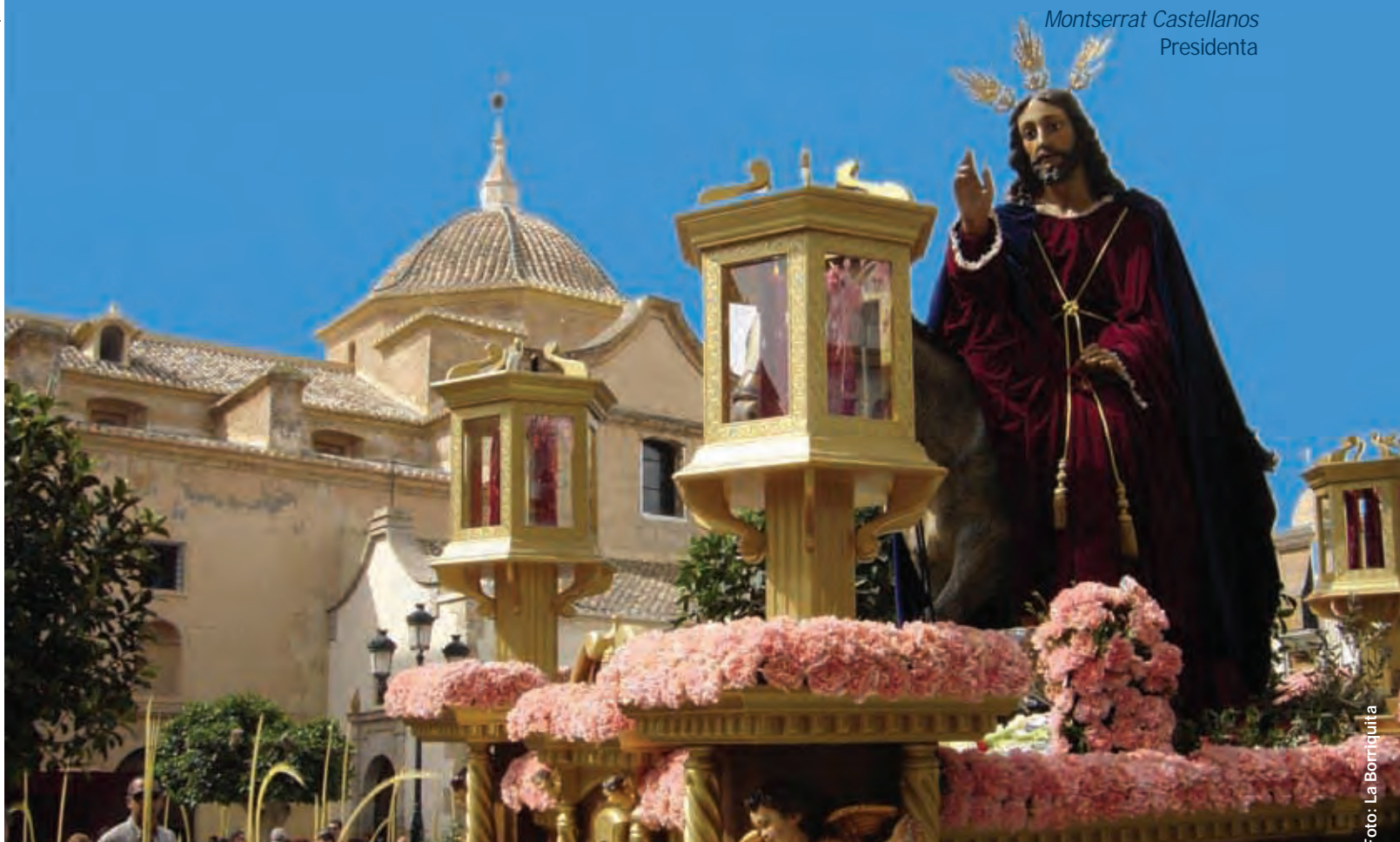
Paso de la Borriquita en un soleado Domingo de Ramos.