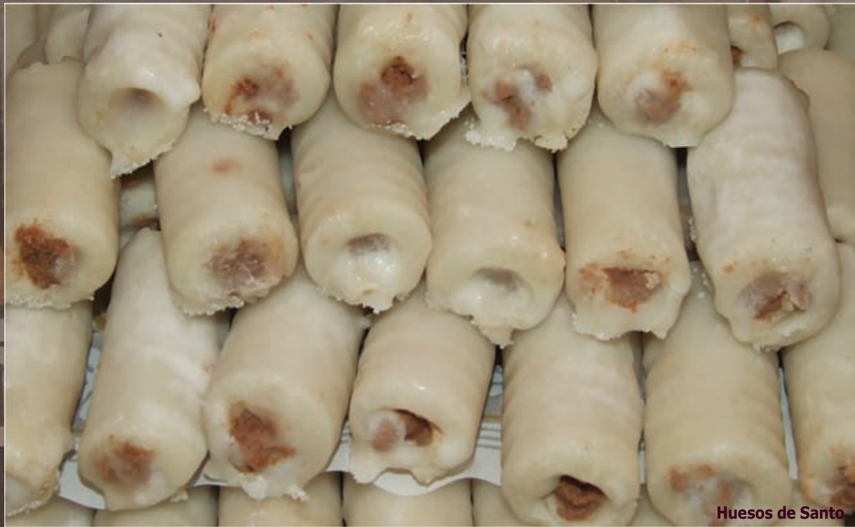
Huesos de Santo