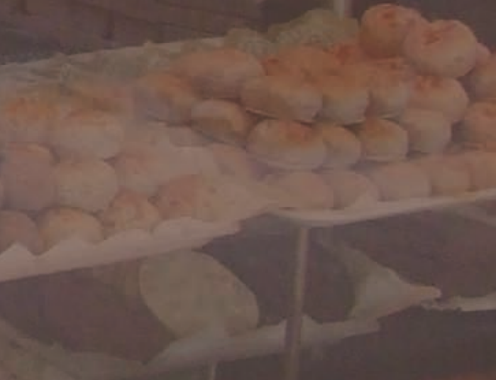
Huesos de Santo Baileys 32,00 M€