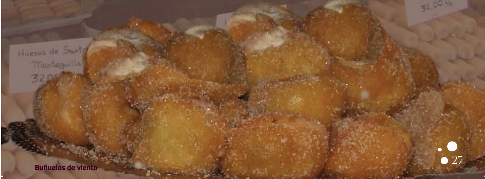
Huesos de Santo Mantegulla 32,00 M€